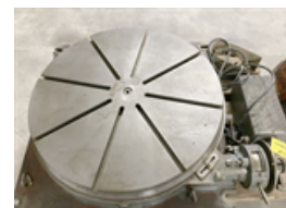
Tavola girevole Esecuzione:

Gruppo Tavola circolare Produttori SIP Tipo PD - 6