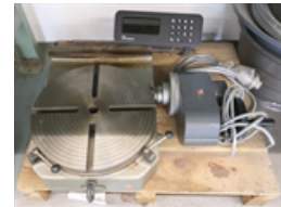
Table tournante Horizontale/verticale Surface de serrage: Diamètre 320 mm Charge admise sur la table max. 250 kg Nombre rainures en T 4 Largeur rainures en T 14H7 mm Poids propre 80 kg Encombres: Longueur 650 mm Largeur 450 mm Hauteur 150 mm Accessoires divers: Visualisateur digital, nombre d'axes: 1 Avance fine

Groupe Table tournante Fabricant HOFMANN Type 320 R