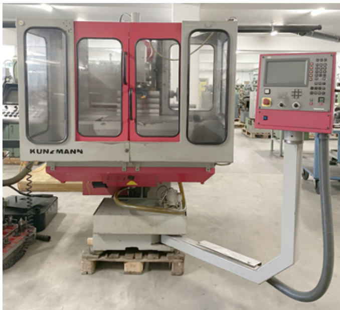
Table fixe Commande à distance électronique Manivelles mécaniques Protection intégrale Dispositif d'arrosage Graissage central automatique Interface port série RS 232