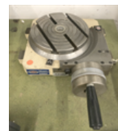
Table tournante Surface de serrage: Diamètre Nombre rainures en T Largeur rainures en T Poids de la machine env. Encombresments: Longueur Largeur Hauteur

Groupe Table tournante Fabricant ALLEN Type TD 200